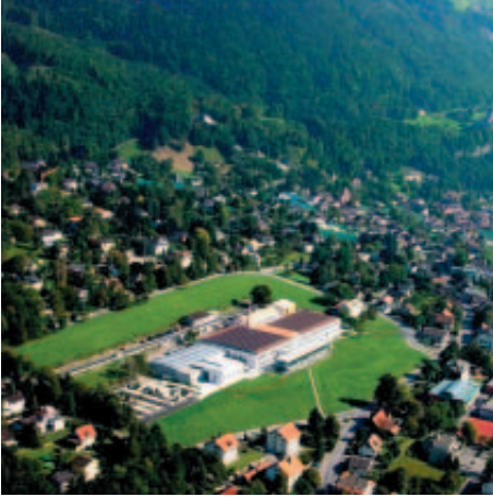
Die Hochschule Liechtenstein, in einer ehemaligen Baumwollspinnereifabrik

Die Studiengänge auf dem Hochschul-Campus erfüllen modernste internationale Standards. Mit dem Institut für Finanzdienstleistungen macht sie sich im deutschsprachigen Europa einen Namen für Banking und Financial Management.