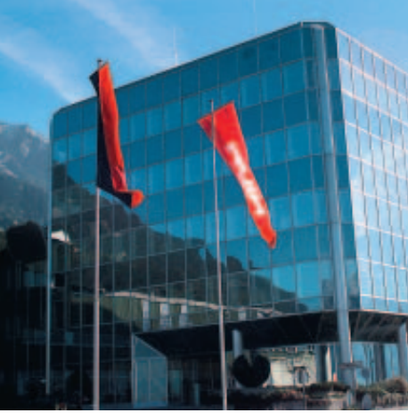
Viele Unternehmen besetzen international Marktnischen

reduzieren. Eine Million Lenksäulen produziert die Gruppe allein für den chinesischen Markt, Mitte 2006 eröffnet sie im Boommarkt China einen dritten Standort für gebaute Nockenwellen – ganz nach dem Motto «follow the customer».